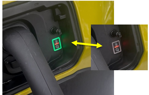
Neben Ladekabel blinkt das Licht grün