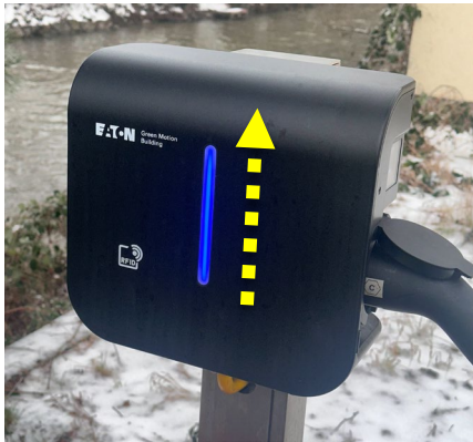
Blauer Lichtbalken an Ladesäule (Aufwärtsbewegung)