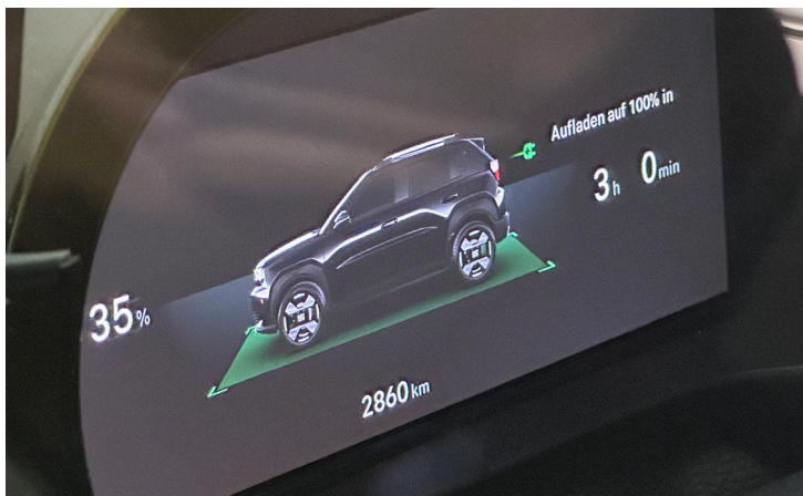
Ladestatus am Armaturenbrett mit %-Stand und restlicher Ladezeit wird angezeigt